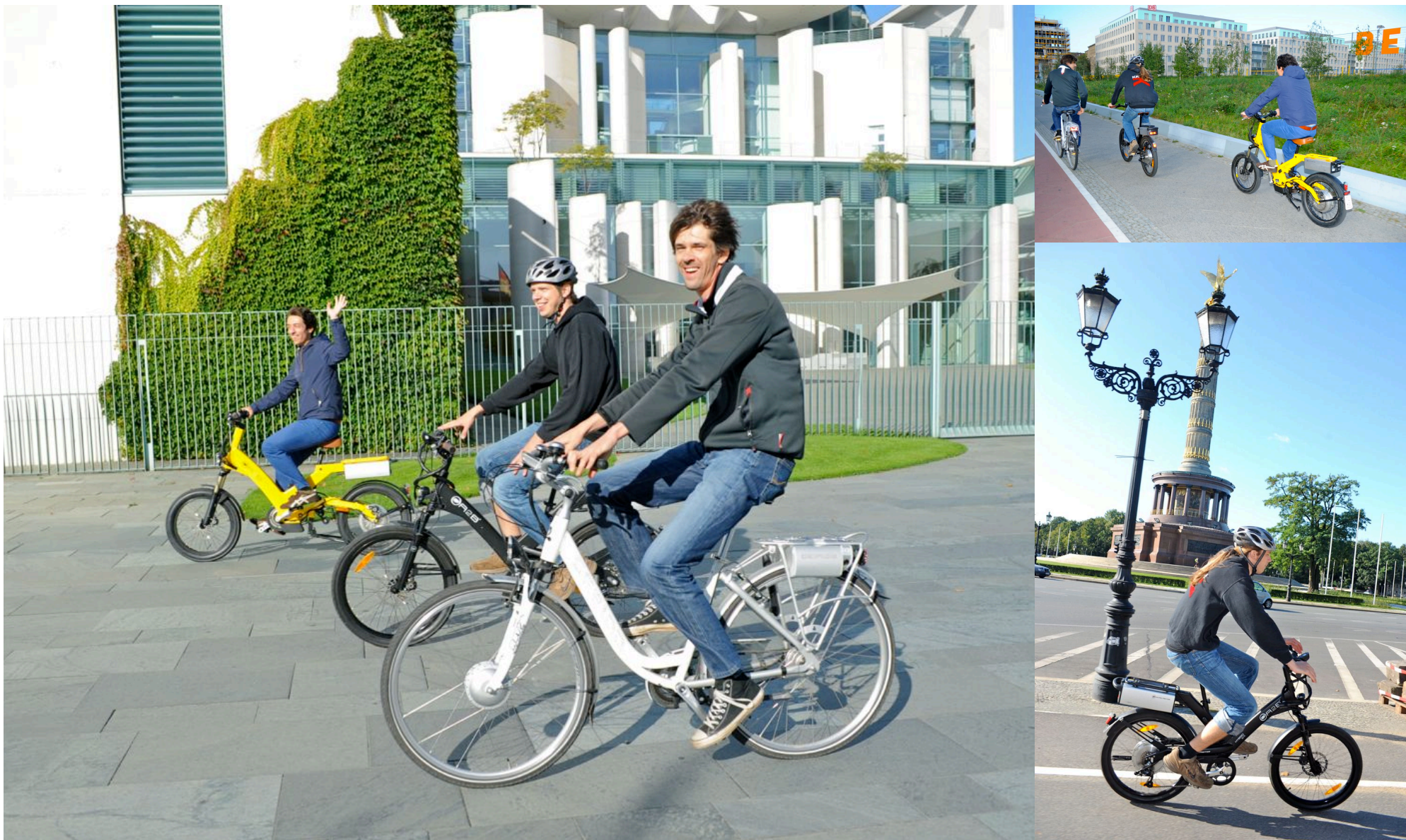
Auf Elektrorädern von der Wattstraße in den Tiergarten