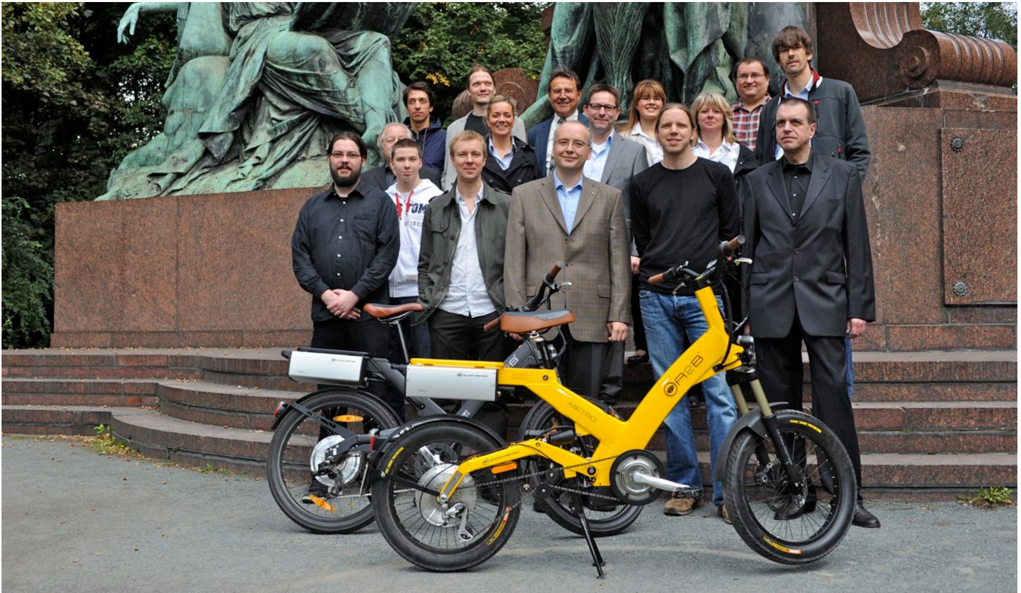
Das DIGALOG Team, spezialisiert auf die Entwicklung und Produktion von Steuerungselektronik