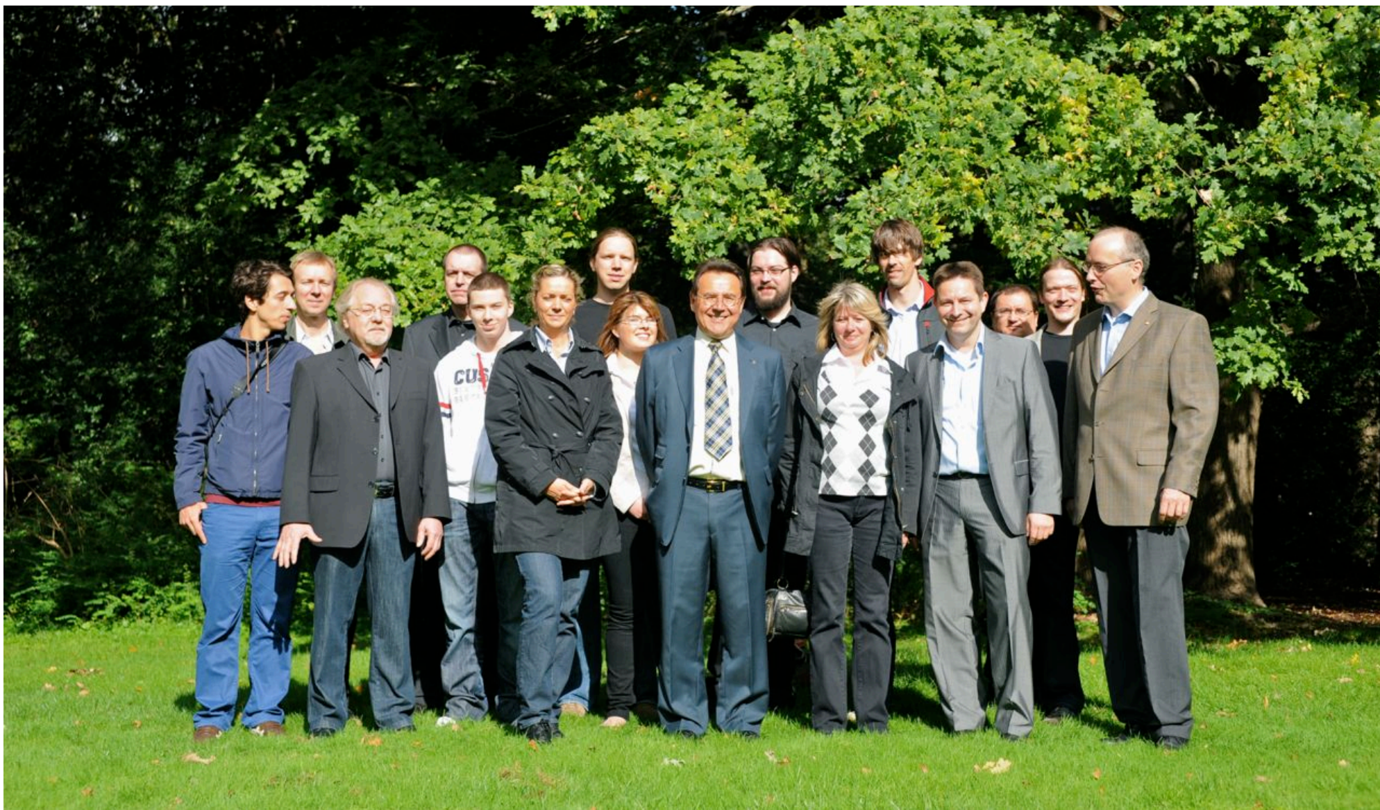
Das DIGALOG Team im Berliner Tiergarten