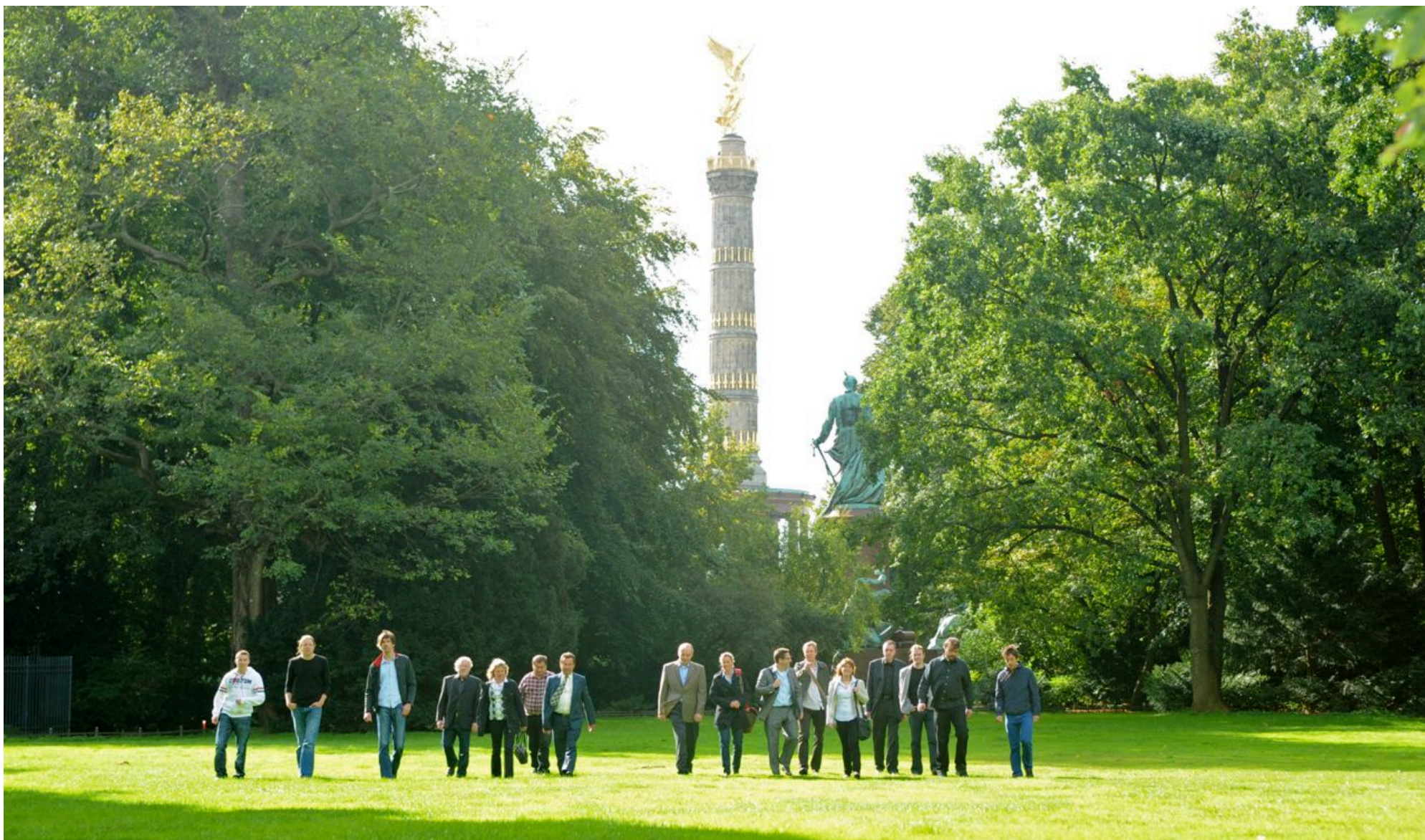
DIGALOG im Zeichen der Siegessäule