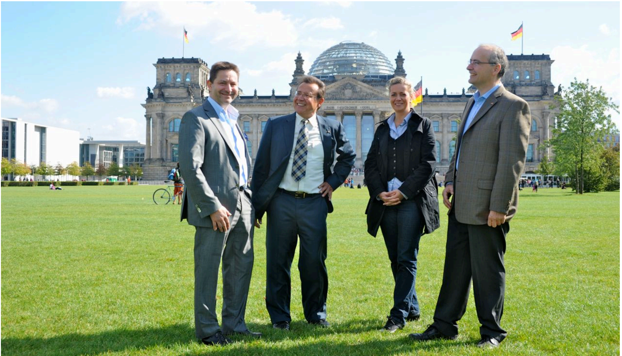
DIGALOG's Geschäftsführung vor dem Berliner Reichstagsgebäude